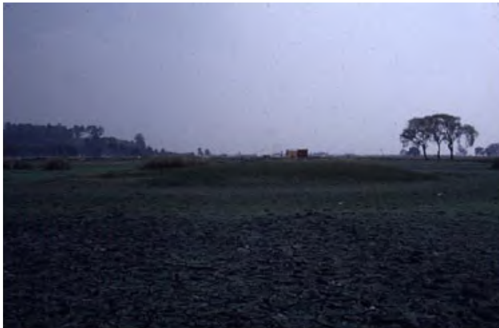
Figura 4. Bordos. Santa Cruz Atizapan.

podieron haber cumplido una función pública. Uno por lo menos fue construido para sostener una estructura pública con muros de piedra de considerable tamaño.