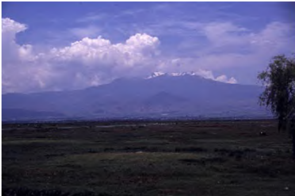
Figura 2. La Ciénaga de Chignahuapan, Santa Cruz Atizapan, Estado de México.