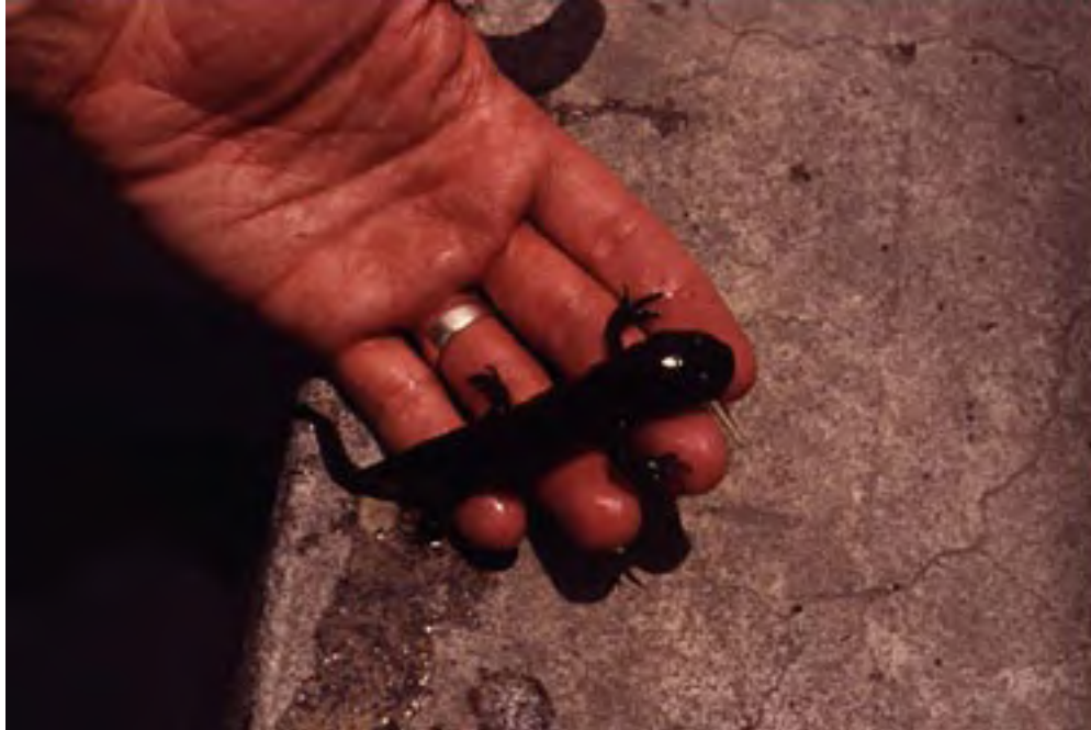
Figura 12. Ajolote ( Ambystoma sp.).

Una vez más, reconsiderar estos materiales en asociación con rasgos y otros materiales arqueológicos, como así también la evidencia proporcionada por los residuos químicos, dará lugar a una interpretación más significativa de los posibles usos de los recursos faunísticos por parte de la población prehispánica de Santa Cruz Atizapan.