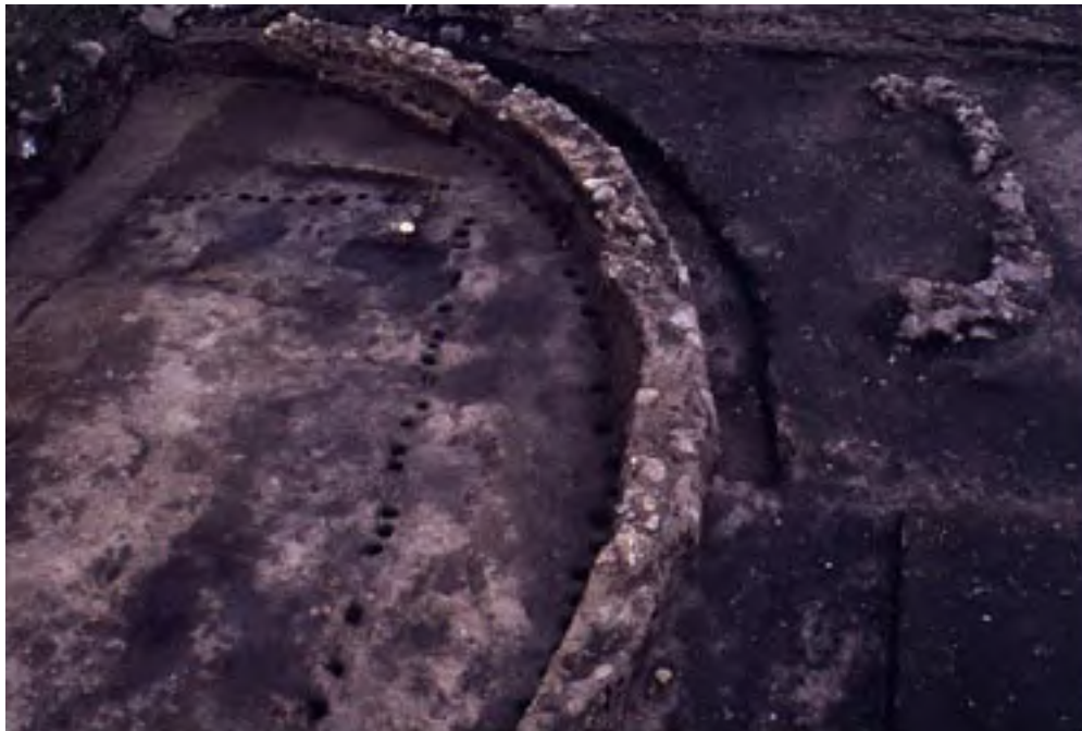
Figura 6. Montículo 20. Cimiento de una estructura circular posterior que rodea a una estructura rectangular anterior.