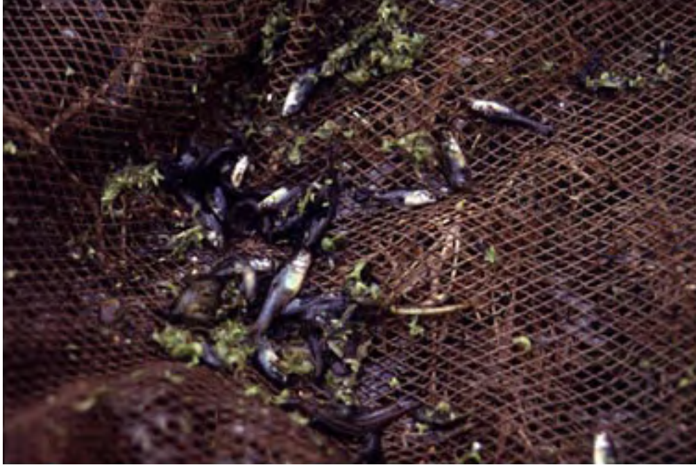
Figura 10. Prietito ( Lermichthys multiradiales ).