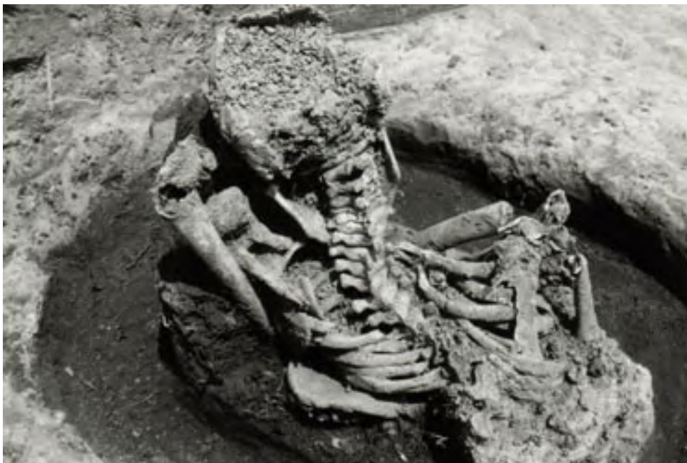
Figura 8. Enterratorio 2, Montículo 20, Santa Cruz Atizapan. Infante de entre 1 y 1.5 años de edad.

Los enterratorios de adultos de una excavación previa no muestran signos de causa específica de muerte, como así tampoco hay indicación de actividades rituales asociadas, aunque algunos huesos pertenecientes a los individuos 1, 2 y 3 muestran huellas de quemado. Los individuos 2 y 3 muestran distorsiones de los metatarsos y falanges de ambos pies, lo que sugiere una actividad prolongada en posición de flexión.