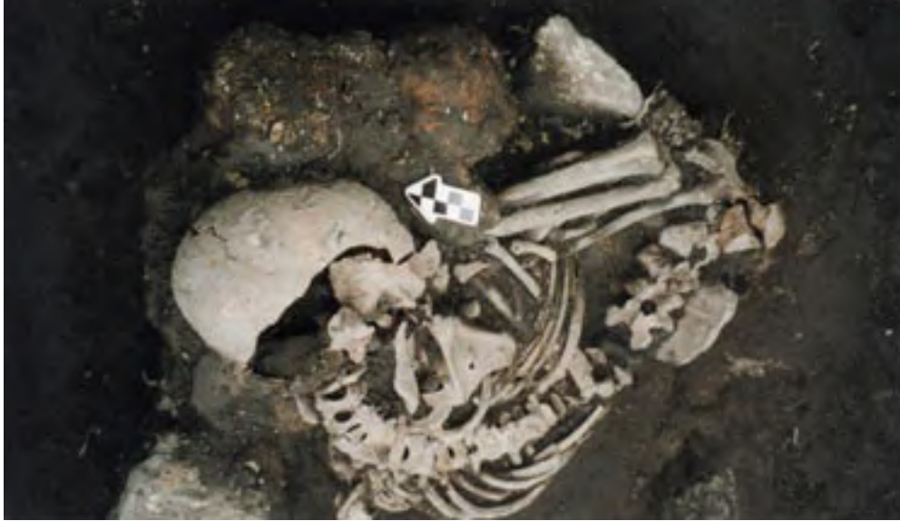
Figura 7. Enterratorio 1, Montículo 20, Santa Cruz Atizapan. Infante de aproximadamente 6 años de edad.

Los enterratorios de adultos de una excavación previa no muestran signos de causa específica de muerte, como así tampoco hay indicación de actividades rituales asociadas, aunque algunos huesos pertenecientes a los individuos 1, 2 y 3 muestran huellas de quemado. Los individuos 2 y 3 muestran distorsiones de los metatarsos y falanges de ambos pies, lo que sugiere una actividad prolongada en posición de flexión.