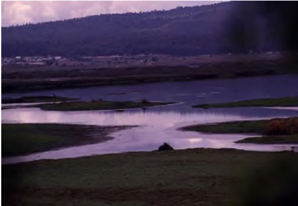
Figura 3. Bordos en la Ciénaga de Chignahuapan, Santa Cruz Atizapan.

actividades agrícolas, lo cual implica que los habitantes debían explotar los recursos naturales lacustres para obtener alimentos y materias primas para la elaboración de productos artesanales, los cuales podían intercambiar por otros productos disponibles en distintas partes del valle ( Figura 3 , abajo).