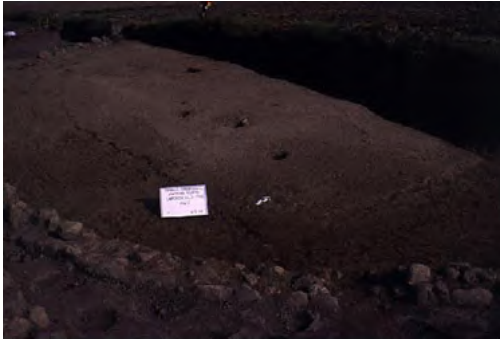
Figura 5. Sector sur. Piso 3 del Montículo 20. Estructura circular con cimientos.