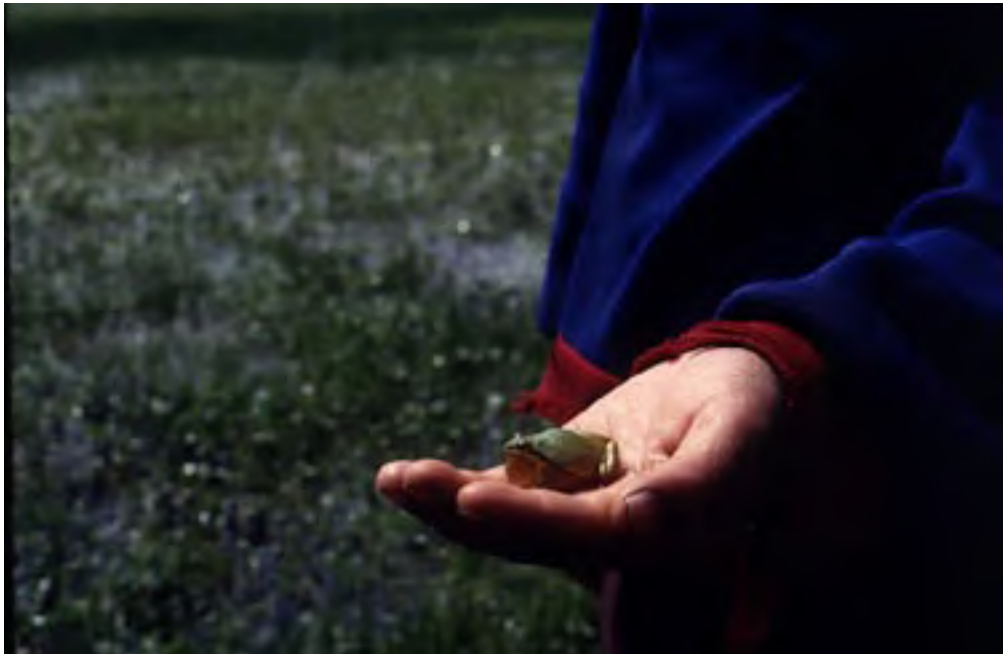
Figura 11. Rana ( Hyla eximia ).