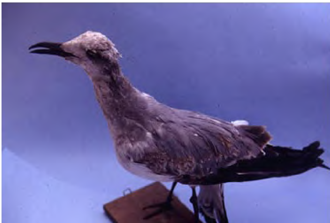
Figura 9. Cuachililla joven ( Larus atricilla , gaviota). Aves acuáticas estacionales características de la ciénaga de Santa Cruz Atizapan.